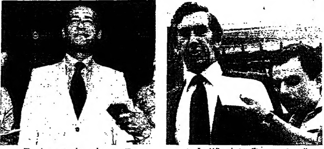
لاين : تصريح تقليدي في الخارجية .. و بطرس يذلي بتصريحه في القصر

قبل ان يتوجه الى القصر الجمهوري لحضور جلسة مجلس الوزراء ، استقبل وزير الخارجية السيد فؤاد بطرس عند الساعة التاسعة والنصف من قبل ظهر امس في قصر بستان القلم بالاعمال الاميري السيد جورج لاين وكان اجتماعا مطولا دام حوالي الساعة الحادية عشرة ، دار البحث خلاله حول تطورات الوضع الراهن في الجنوب والمساعدات الخارجية التي تقدمها الحكومة اللبنانية الى الامم المتحدة ، ووزارة الخارجية ، ولدى مغادرته وزارة الخارجية ، قال لاين : لقد بحثنا في المواضيع التي نهضنا عنها بالامس في سبيلها وزير الخارجية في نيويورك ، وأكد تطرق البحث الى الوضع في الجنوب الذي يستلزم اهتمام حكومتنا ، وسئل : هل تلتفت جهة نظر أميركية معينة بالنسبة الى الجنوب ؟ اجاب : لا تعليق ، لما الوزير بطرس فقال : لا شيء في الضمائم .. وذكرت مصادر وزارة الخارجية ان القائم بالاعمال الاميري أكد للوزير فؤاد بطرس ان الولايات المتحدة الأميركية ما زالت عند استعدادها للتقليدية في المحافظة على سيادة لبنان وسلامة اراضيها ، وهي تعهدات بهذا الصدد ، ووزارة الخارجية الى الامم المتحدة ، ووزارة الخارجية ، ولدى مغادرته وزارة الخارجية ، قال لاين : بعد ذلك توجه الوزير بطرس الى القصر الجمهوري لحضور اجتماع مجلس الوزراء ، ( التفاصيل على الصفحة ٢ ) وسبق الجلسة خلوة بين رئيس الجمهورية ورئيس الحكومة فؤاد لاين ، منها البحث في التطورات الالمنية والسياسية .